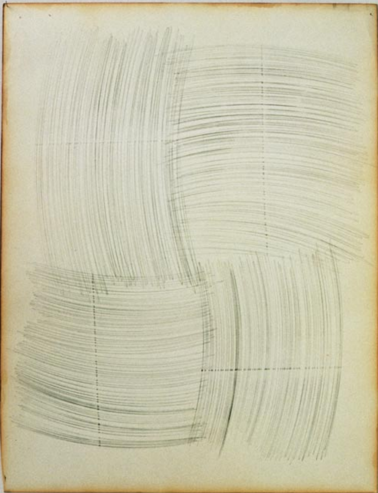
Jiří Hilmar, Bez názvu, 1974, tužka